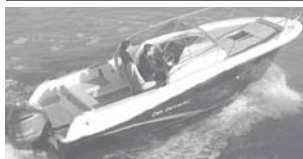
Cap Camarat 7.5 WA