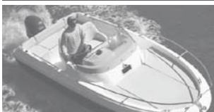
Cap Camarat 5.5 WA