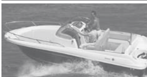
Cap Camarat 6.5 WA